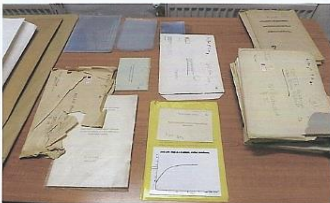
6. fotó Ismeretlen összetételű műanyag tasakokban tárolt dokumentumok, fém iratkapoccsal összefogott fényképek