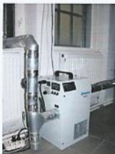
2-3.fotó A nagy levéltári raktárunk