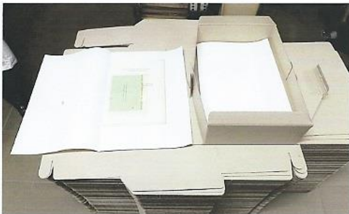
8. fotó A savmentes levéltári dobozokba végül, savmentes palliumokba csomagolva kerülnek bele az iratok

Köszönjük a célul kitűzött feladat teljesítéséhez nyújtott segítségüket.