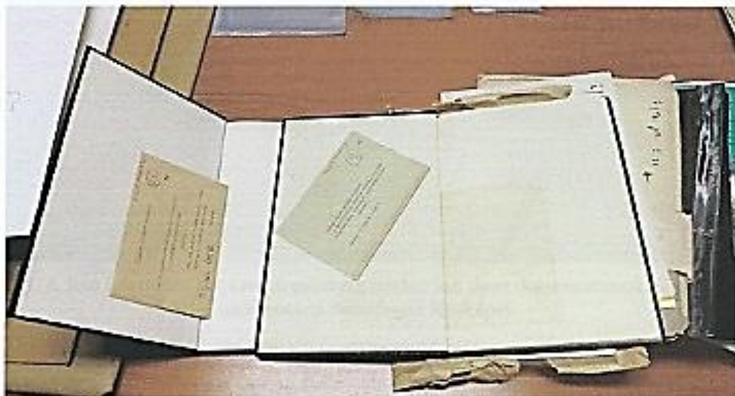
4.fotó A rossz papíralapanyagból készült boríték felgyorsította a könyv előző anyagának az öregedését

Az gyűjtemény feldolgozása elkezdődött és folyamatos.