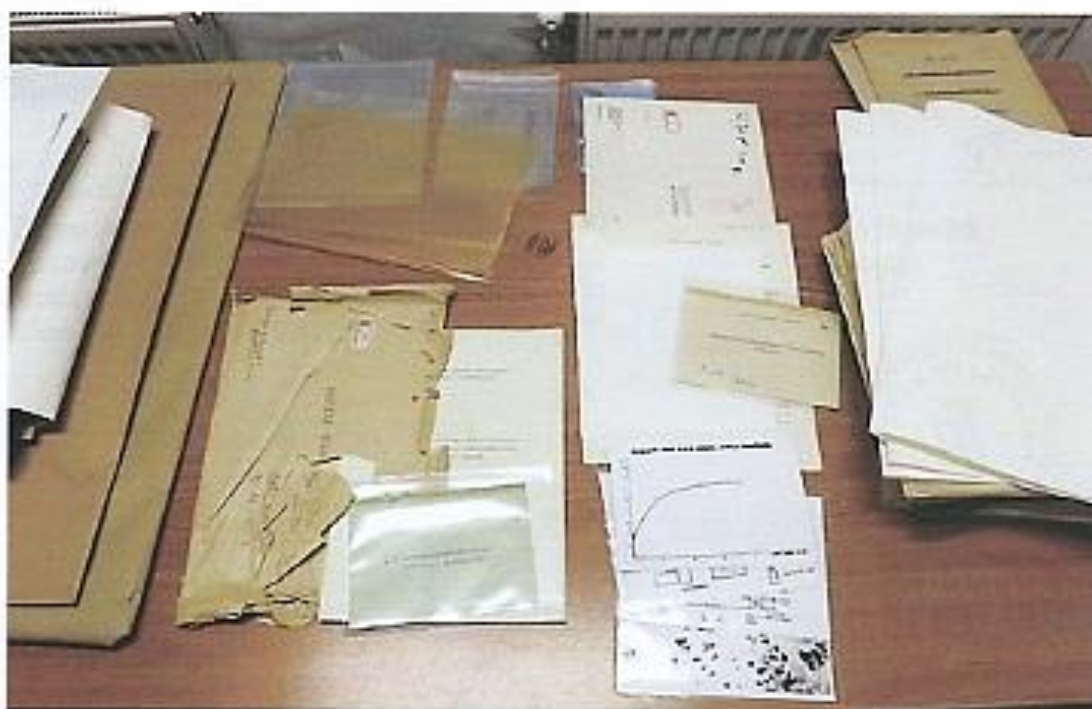
7.fotó Az A/4-es iratokat savmentes palliumba, a fotókat, a kisebb iratokat, a borítékolt leveleket PP iSafe tasakokba tettük