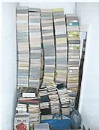
1. fotó MOTESZ dokumentumok az átmeneti raktárban

Az NKA által 2014 tavaszán kiírt pályázaton támogatást kértünk, a Semmelweis Orvostörténeti Levéltár gyűjteményébe 2009 végén bekerült, és még feldolgozatlan MOTESZ anyag átcsomagolásához. A dokumentumok (iratok, oklevelek, fényképek stb.), vegyes csomagolásban (elkoszolódott levéltári dobozokban, hullámkarton dobozokban) érkeztek az intézménybe. Jelenleg egy átmeneti raktárban raktározódnak.