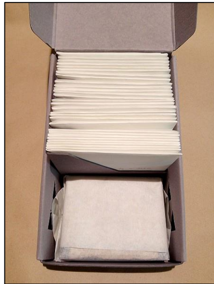
3. ábra. Savmentes dobozok és palliumok felhasználása Röntgen- és üvegnegatívek valamint kromotípa tárolására