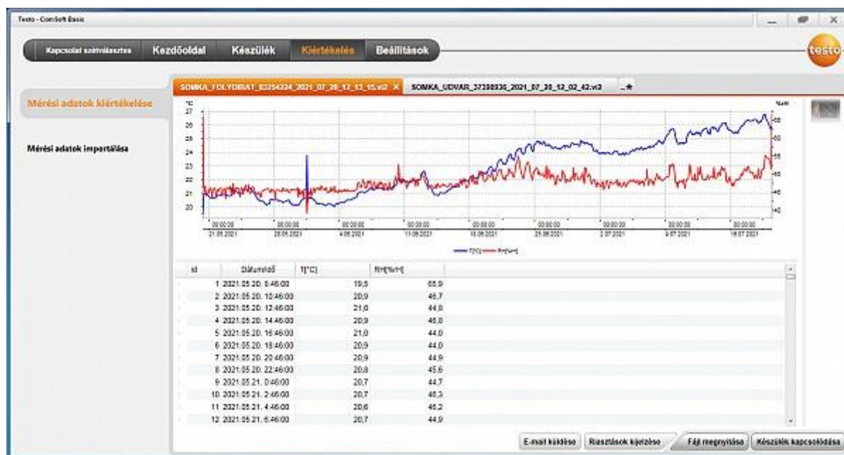
1. ábra. Az egyik mérési helyszín: SOMKA folyóiratraktár

Olyan mérőműszerek beszerzését terveztük, amelyek a folyamatos monitorozás mellett a begyűjtött adatokat tárolni (és alkalmas szoftver segítségével) elemezni is tudják. A 4 db testo 174 H mini adatgyűjtős műszer helyett 6 db-ot vásároltunk, ezek ui. azokon a helyszíneken is felhasználhatók voltak, ahová a gyenge Wifi jelerősség miatt (az eredeti tervekkel szemben) nem lett volna lehetséges Wifis adatgyűjtő kihelyezése. Ennek megfelelően csökkentettük a beszerzendő Wifis (160 TH) adatgyűjtők számát, a tervezett 5 db helyett végül csak 4 darabot vásároltunk. Összességében a tervezett 9 db mérőműszer helyett így 10 db műszerhez jutottunk, melyeket ki is helyeztünk a megfelelő helyszínekre.