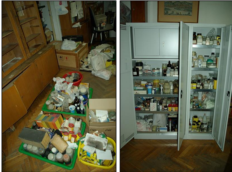
4. ábra. Vegyszerek átrendezése (régi és új állapot)

A pályázatban szereplő vegyszerszekrényeket a terveknek megfelelően meg tudtuk vásárolni, a vegyszerek átpakolása (és ezzel egyidejűleg a már használhatatlan vegyszerek selejtezése) megtörtént.